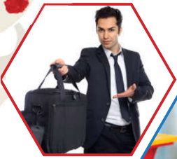
Bu, onun çantası